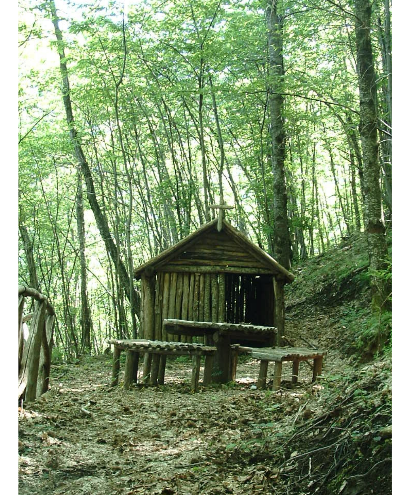
MM: macchia mediterranea con prevalenza di castagno, leccio, pino e quercia Località sentiero Scorza San Michele