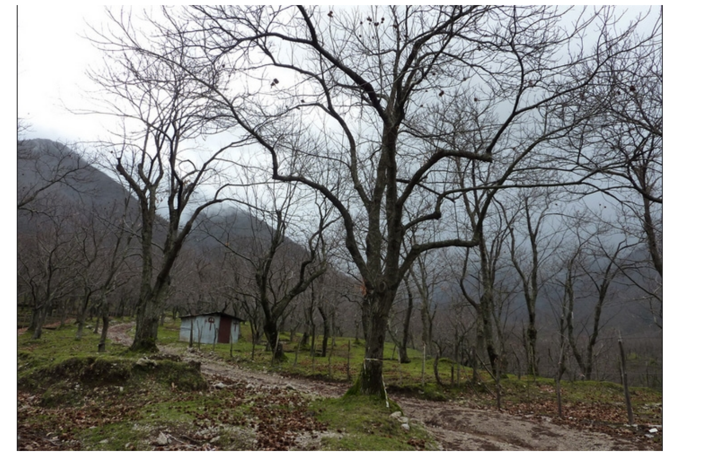
CF: castagno da frutto Località Selvapiana