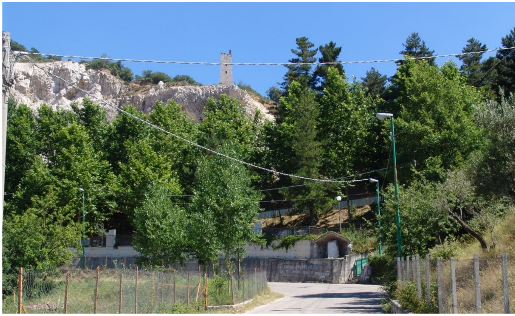
CE: cedui di cerro - Località Madonna della Neve