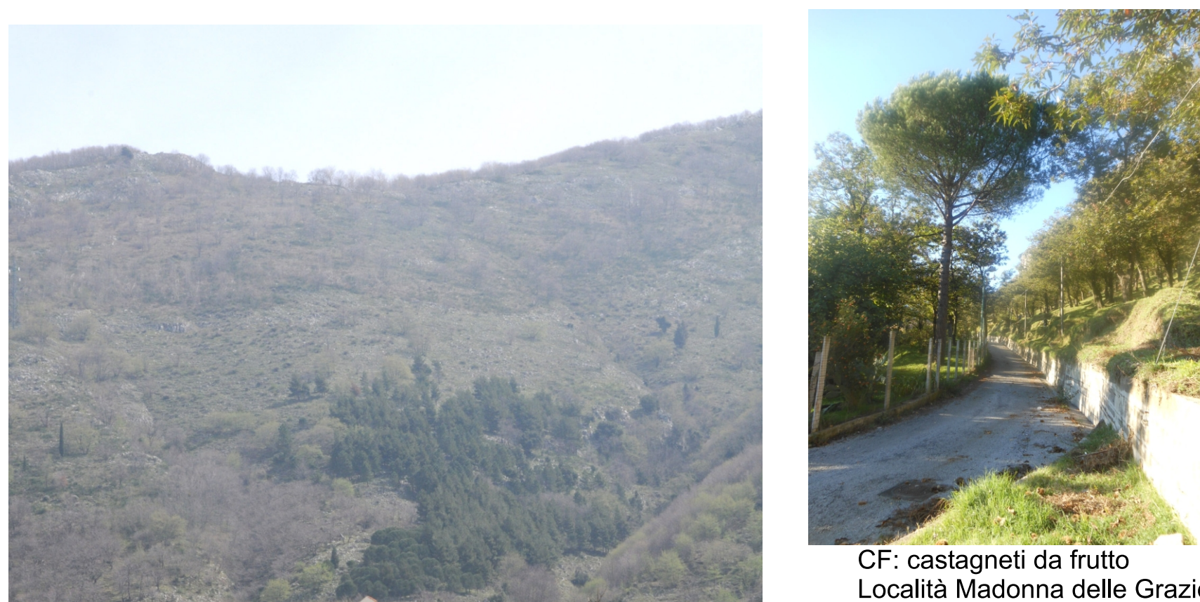
CF: castagneti da frutto Località Madonna delle Grazie