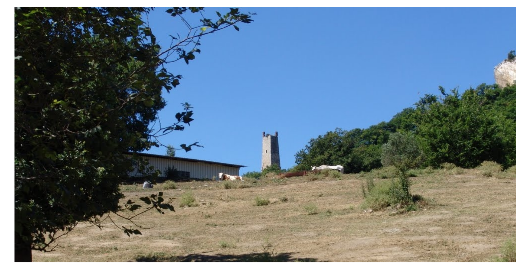
PA: pascoli - Località Taverna Turci