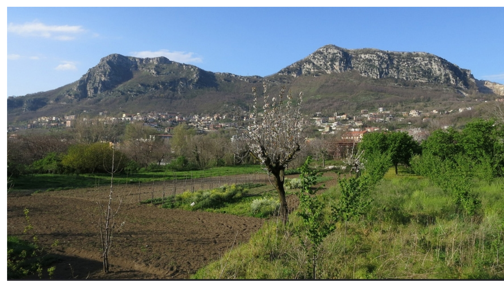
SA: seminativi arborati e frutteti; SI: seminativi irrigui Vallone Santo Spirito