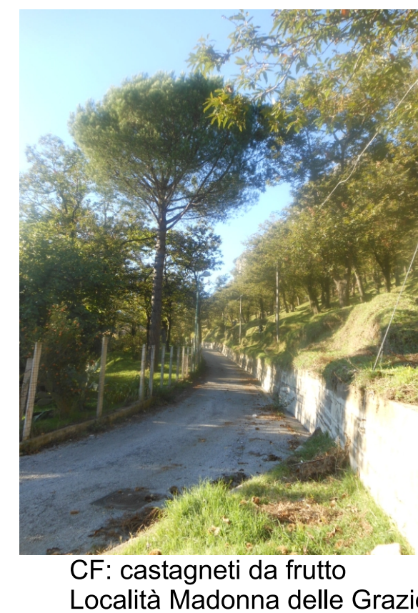
CF: castagneti da frutto Località Madonna delle Grazie