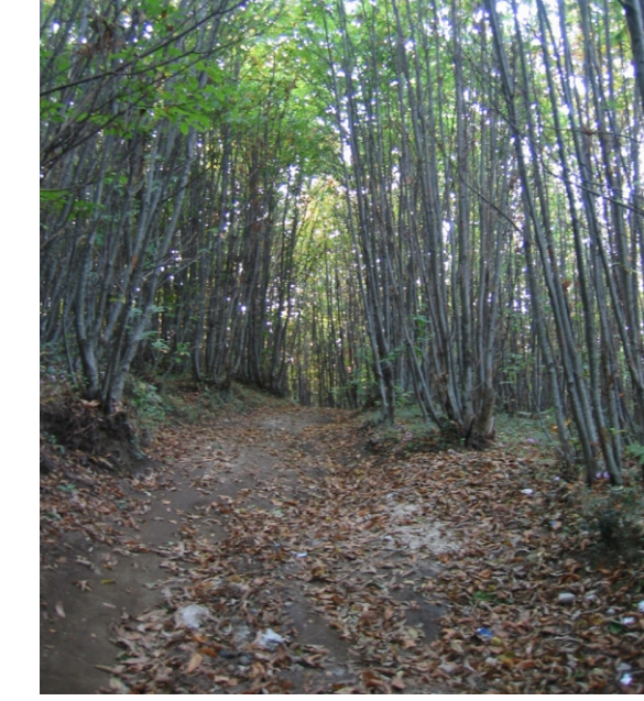
CQC: cedui misti con prevalenza di quercia e cerro Località Monte Bosco Materdomini