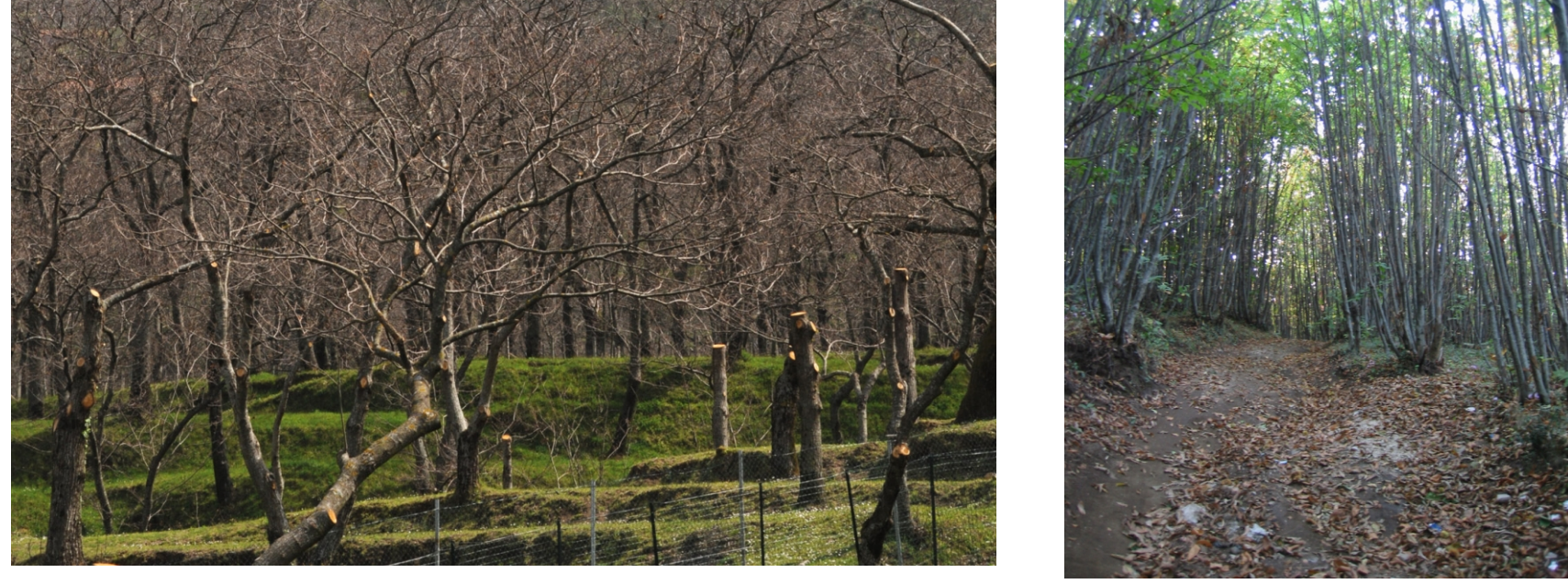
CF: castagneti da frutto; MM: macchia mediterranea con prevalenza di castagno, leccio, pino e quercia Località San Francesco