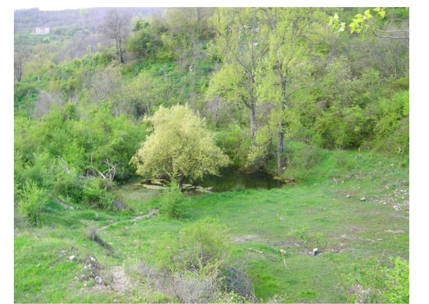
SC: scoperto Località Campopiano antiche fornaci