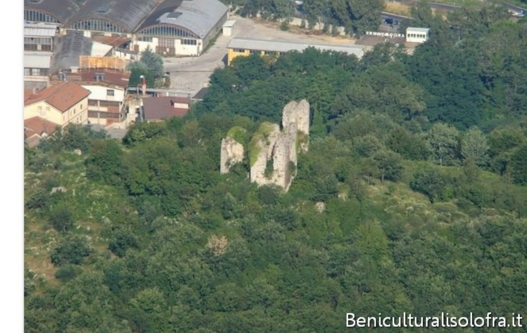
CM: cedui misti con castagno, quercia, cerro e olmo Località Castello